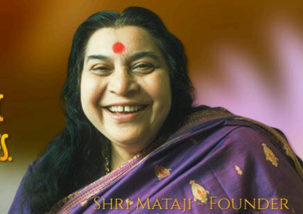
SHRI MATAJI - FOUNDER

PRESENTED IN ENGLISH WITH SUPPORT IN NORDIC AND EUROPEAN LANGUAGES.